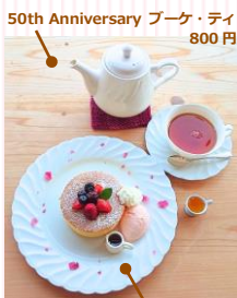
花とゆめ アンバーサリー・ベリーパンケーキ 1,000円