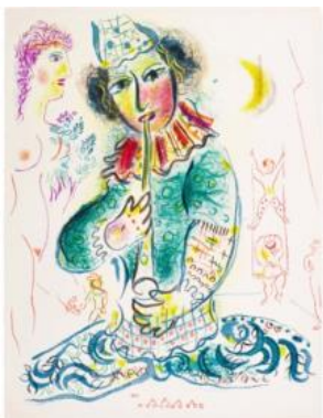
マルク・シャガール版画集「サークス」より 「演奏する道化師」 © ADAGP, Paris & JASPAR, Tokyo, 2026 G4199

20世紀を代表する画家マルク・シャガール(1887-1985)は、鮮やかな色を使った幻想的な絵画で親しまれ、「色彩の魔術師」とも呼ばれています。当館コレクションから約3年ぶりに、サークスをテーマに刊行された版画集から、38点の版画作品をご紹介します。