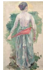
《婦人背面エチュード》1892年

常設展では 9/1(日)まで、県内の美術館5館で連携し、所蔵する黒田の作品を紹介する「没後100年記念 黒田清輝展」を開催中。鹿児島が生んだ画家たちの作品を、ぜひご覧下さい。